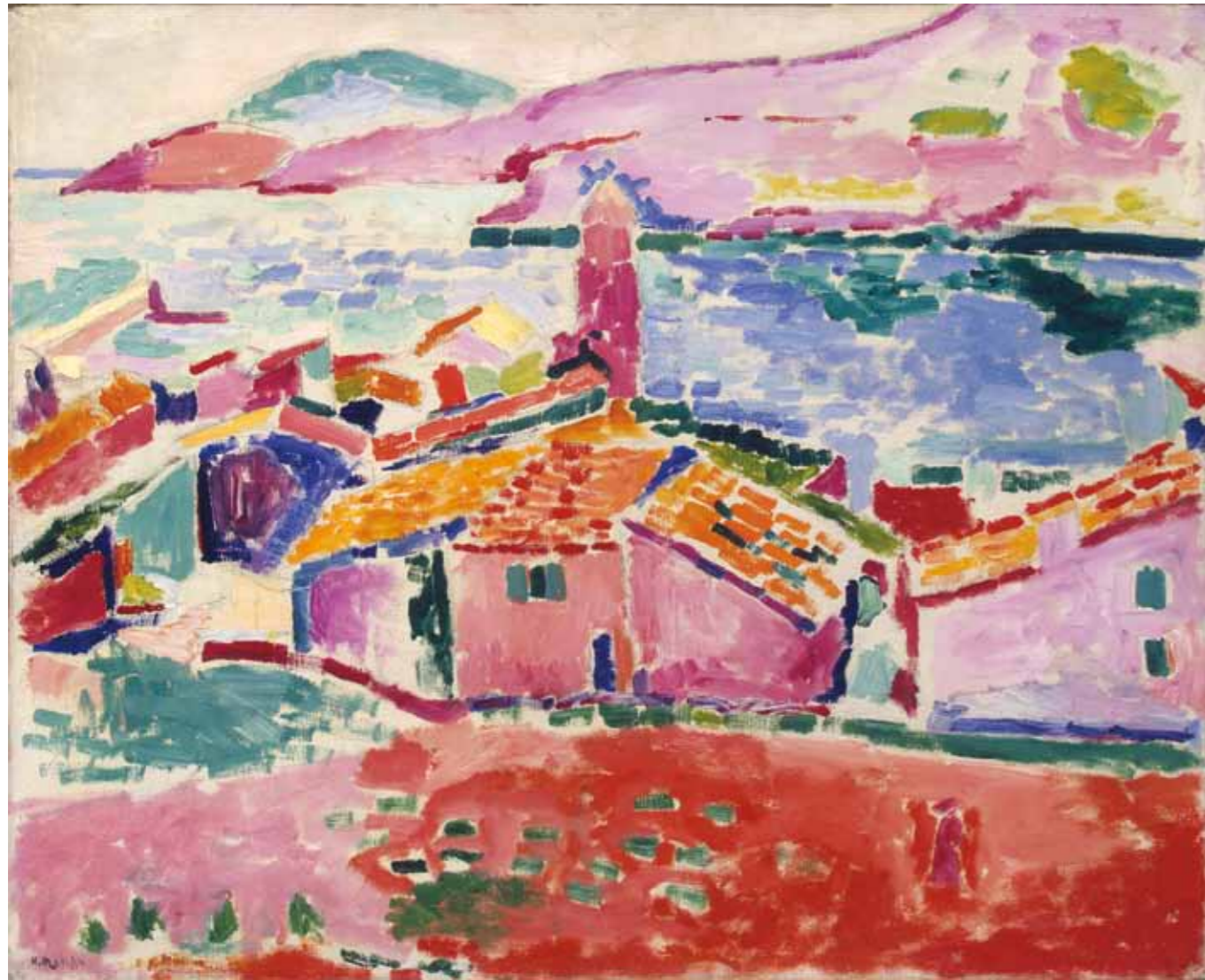
Tage i Collioure, Henri Matisse, Olie på lærred, 60 x 73 cm, The State Hermitage Museum. Matisse og Derain hentede stor inspiration i Collioure til deres farvefyldte, ekspressive malerier, der startede stilartern fauvisme i 1905.

» bejder de aldrig mere sammen. Derain drager til London, hvor han fortsat lader den fauvistiske energi og poesi folde sig ud i fuldt flor. Og selv om deres kolleger Maurice de Vlaminck og Albert Marquet m.fl. også hengiver sig til de stærke rene farver, så bliver fauvismen aldrig en egentlig bevægelse – der mangler ganske enkelt et samlende manifest og kunstteoretiske skrifter. Derimod bliver den et af flere afsæt til ekspresionismen.