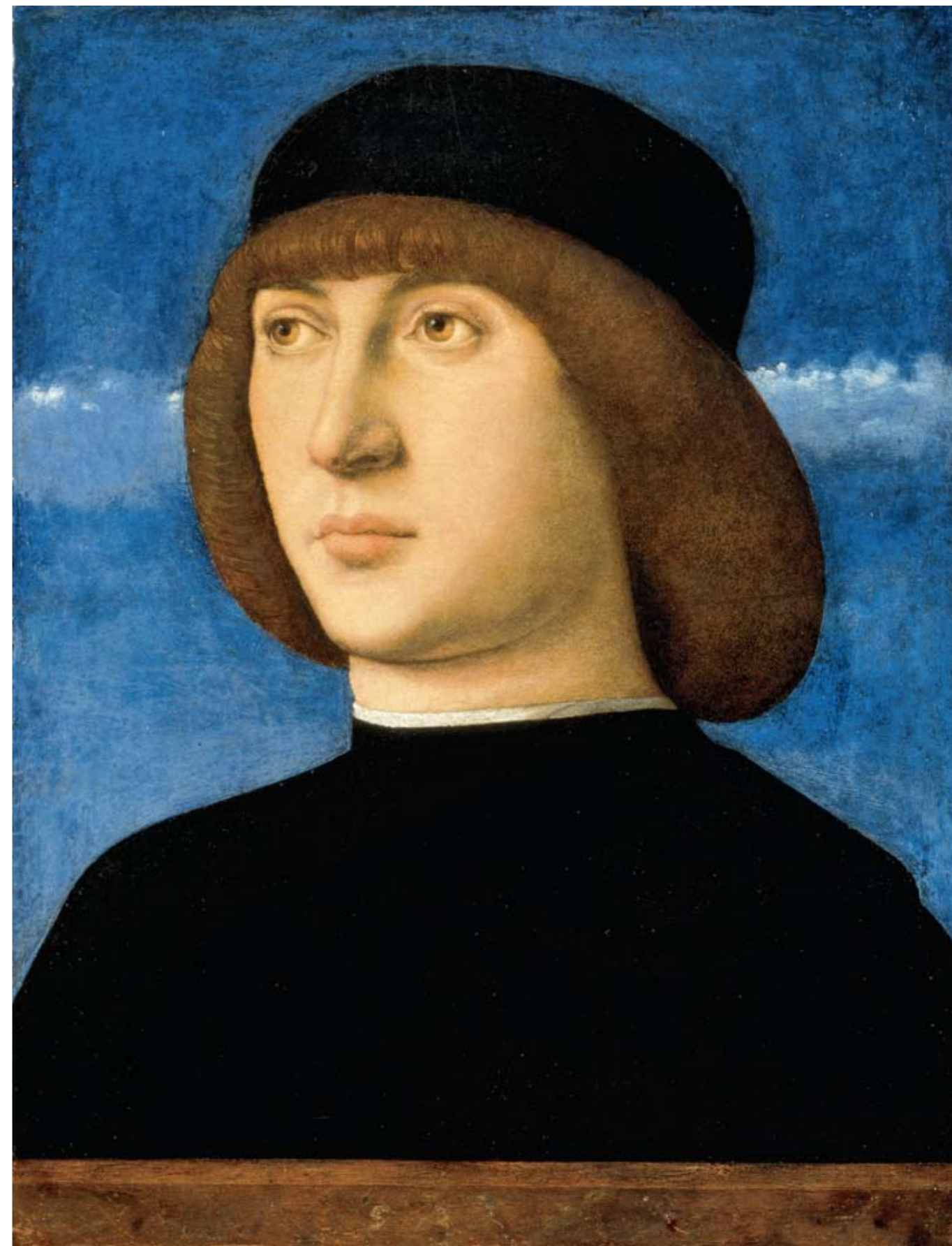
Figur 1 Giovanni Bellini PORTRÆT AF UNG MAND Ca 1500, Olie på træ Tilhører Nivaagaards Malerisamling