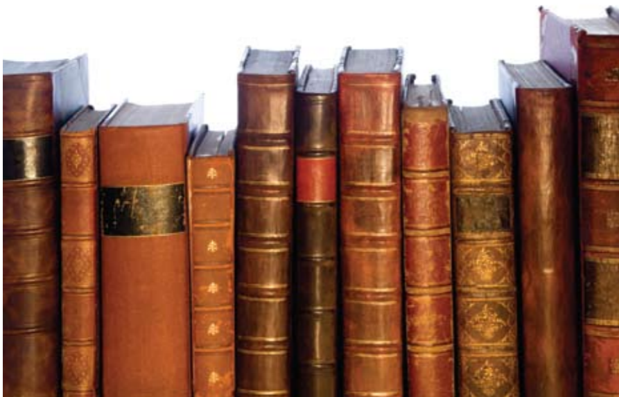
Figur 4 Antikvariske bøger.