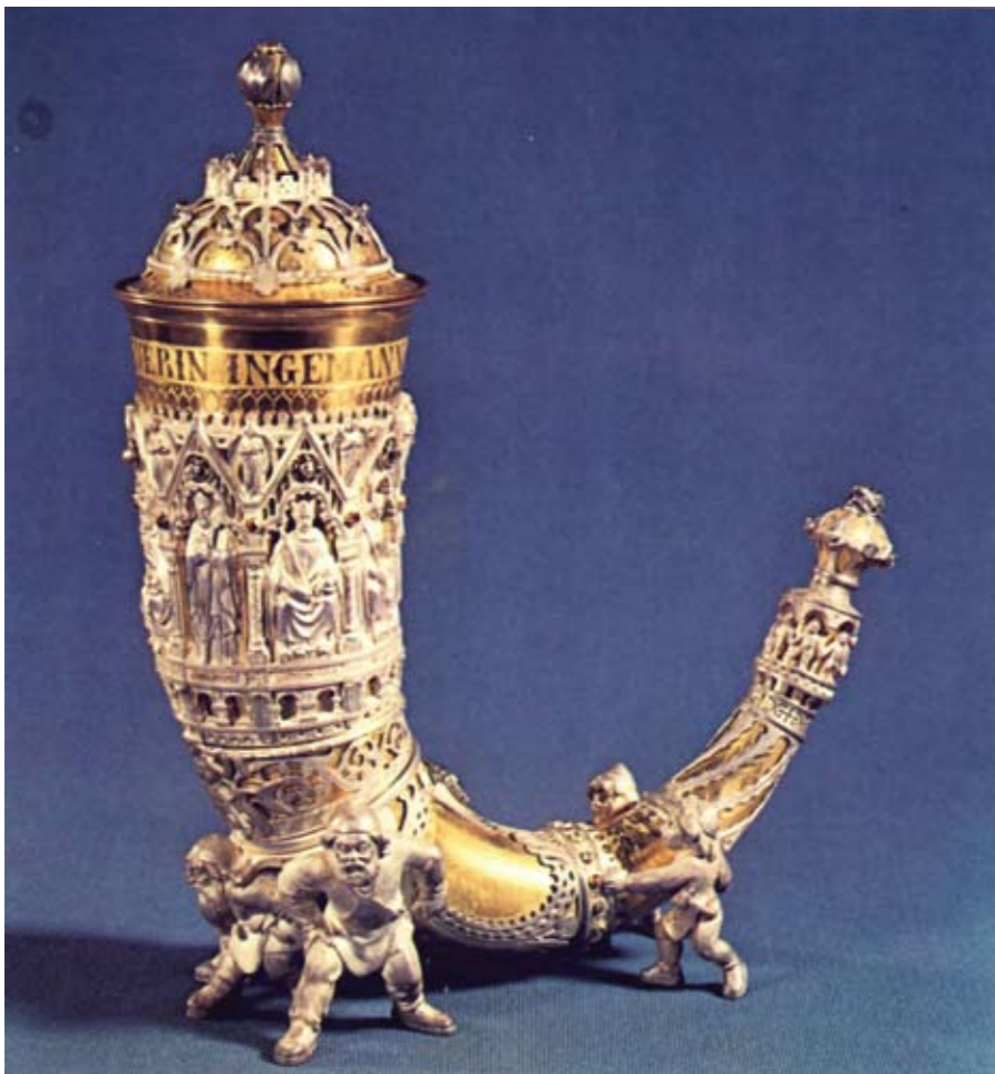
Figur 2 Ingemanns guldhorn, 1859. C. Peters, A. N. Dragsteds Solvsmedie Udsmykket med smaragder, rubiner og brillanter.