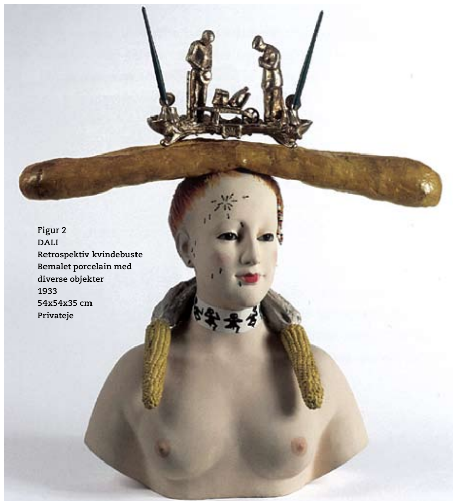
Figur 2 DALÍ Retrospektiv kvindebuste Bemalet porcelain med diverse objekter 1933 54x54x35 cm Privateje

Den eksemplariske udmøntning fandt sted på cafeen Voltaire i Zurich under ledelse af pianisten Hugo Ball i form af absurditeter i digtning, musik, optræden, dans osv. Intellektuelle, kunstnere og gøglere fra hele kontinentet søgte her ly for krigens rædsler og meningsløshed. De samledes om at