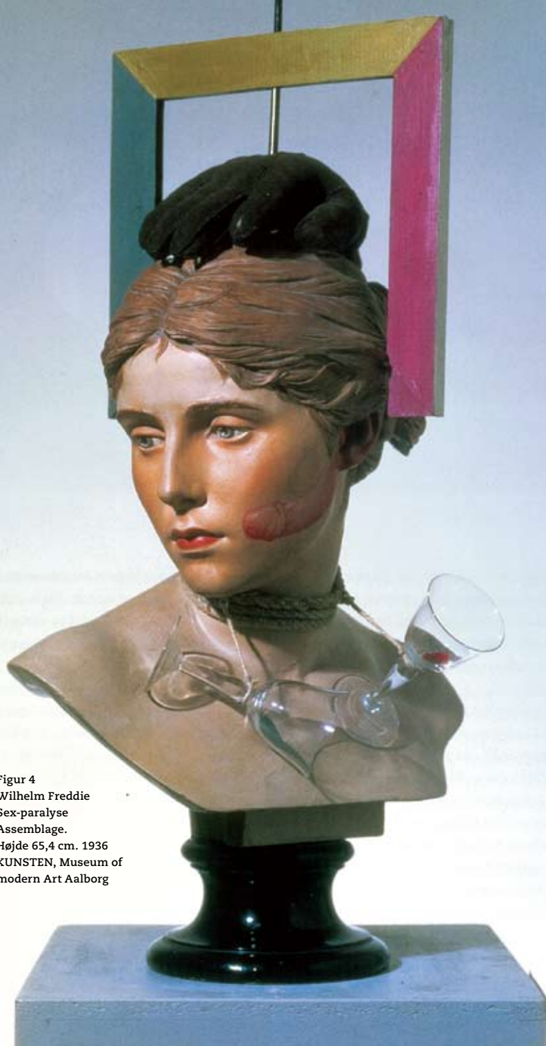
Figur 4 Wilhelm Freddie Sex-paralyse Assemblage. Højde 65,4 cm. 1936 KUNSTEN, Museum of modern Art Aalborg

perimeterende automatskrift, afprøver han forskellige halvautomatiske teknikker. Og billederne fra disse år - serier af muslingeblomster, fiskebensskove og fuglemonumenter - er fyldt med antydninger og hentydninger, en blanding af psykoanalytisk symbolik, fantastiske billedopfindelser og flertydig ironi. Modsat de fleste af sine kolleger fokuserede han ikke specifikt på underlivets kød og lyster. I stedet valgte han med afsæt i et mere vidtfavnende og bredspektret kunstudtryk være en provo for øjet og hjernebarken.