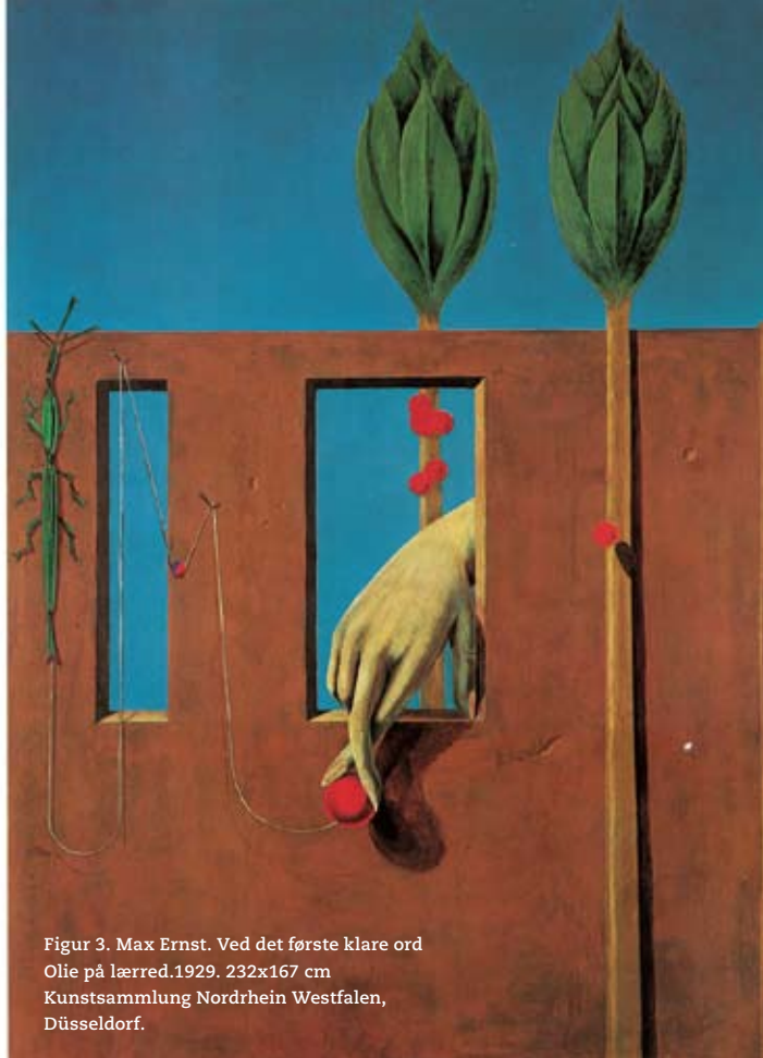
Figur 3. Max Ernst. Ved det første klare ord Olie på lærred.1929. 232x167 cm Kunstsammlung Nordrhein Westfalen, Düsseldorf.

Selv om Dali fastholdt, at hans vær- ker ikke var styret af en bevidst tanke, så var han dog en flittig bruger af psyko- logiens ikonografi såsom en baguette, en gaffelformet krykke og et åbent sår (Figur 2). Helt på samme måde som tid- ligere tiders religiøs kunst omhyggeligt