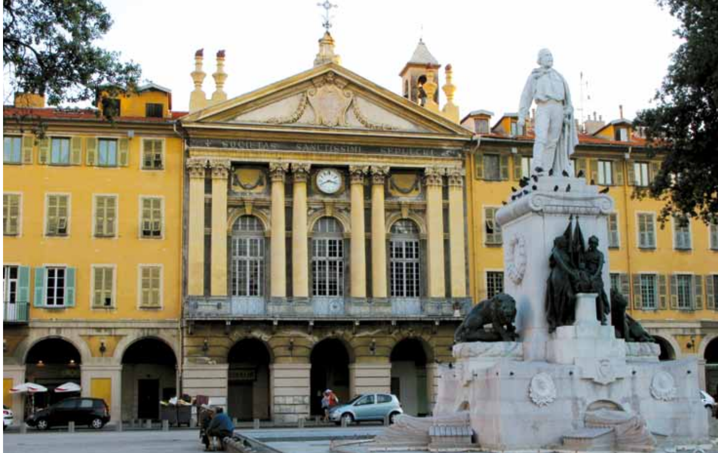
Place Garibaldi har i anledning af 150-året fået en tiltrængt opfriskning. Til højre statuen af Giuseppe Garibaldi og i baggrunden kapellet Saint Sépulcre.

der ville et fransk Nice) får nye blomsterbede. Pont Napoléon er broen over Paillonfloden, der udmunder i Middelhavet lige der, hvor Promenade des Anglais skifter navn til Quai des Etats-Unis. Og statuen af Masséna (marskallen, der også var født i Nice og erobrede byen under revolutionen) flyttes til en endnu mere central position.